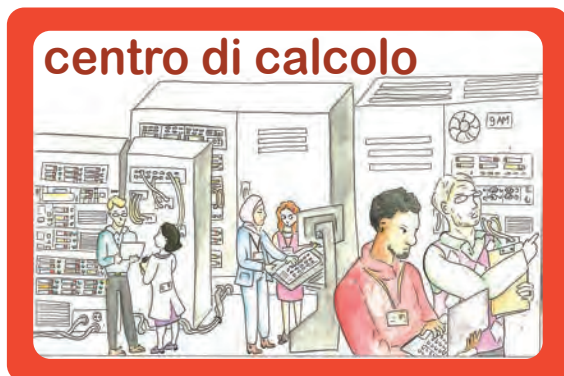
centro di calcolo